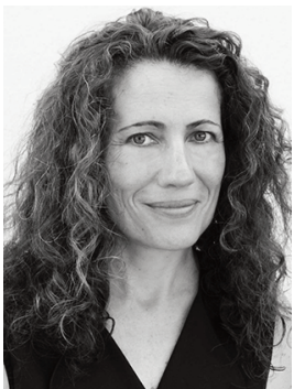
Laetitia Soléry Conseil éditorial et rédaction